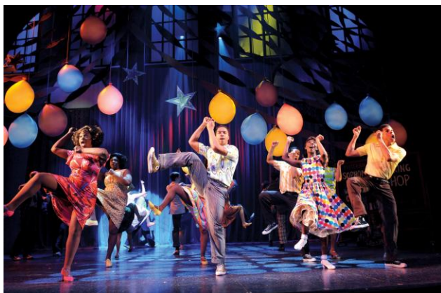
Foto der Westendproduktion

"Wenn ich gefragt wurde, welchen Traum hast Du noch, welchen Künstler möchtest Du nach all deinen Erfolgen noch präsentieren?“, schwärmt Marek Lieberberg, der mit seiner Konzertagentur bereits sämtliche Weltstars der internationalen Musikszenen nach Deutschland gebracht hat, „dann habe ich nie mit einem einzelnen Namen geantwortet, sondern stets nur eins gesagt: Hairspray!"