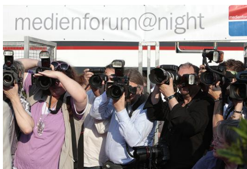
Alles dabei: medienforum@night