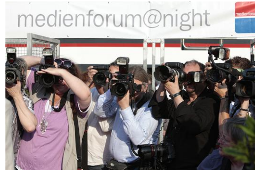
Alles dabei: medienforum@night